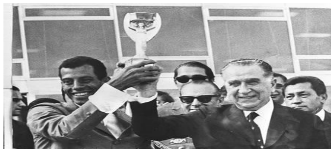
Regime Militar. Brasília, o capitão Carlos Alberto Torres ergue a taça Jules Rimet com o General-Presidente Médici, na volta da Copa do Mundo do México.

Relacione a imagem a seus conhecimentos sobre a história da Educação Física no Brasil e marque a alternativa correta .