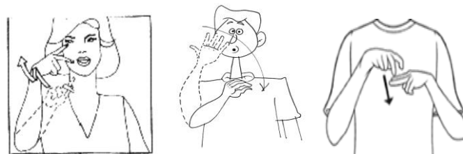
(FERREIRA,2013) ( www.acessobrasil.org.br ) (IESED|Brasil|S.A)

Os morfemas são divididos em lexicais e gramaticais. Em LIBRAS, nem sempre os morfemas que formam as palavras em sinais são equivalentes aos morfemas do português. A sequência na ilustração do morfema da LIBRAS abaixo equivale, respectivamente, aos morfemas: